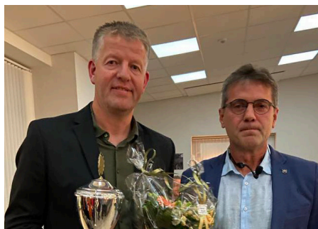
Glimt fra årets klubfest læs mere på de kommende sider