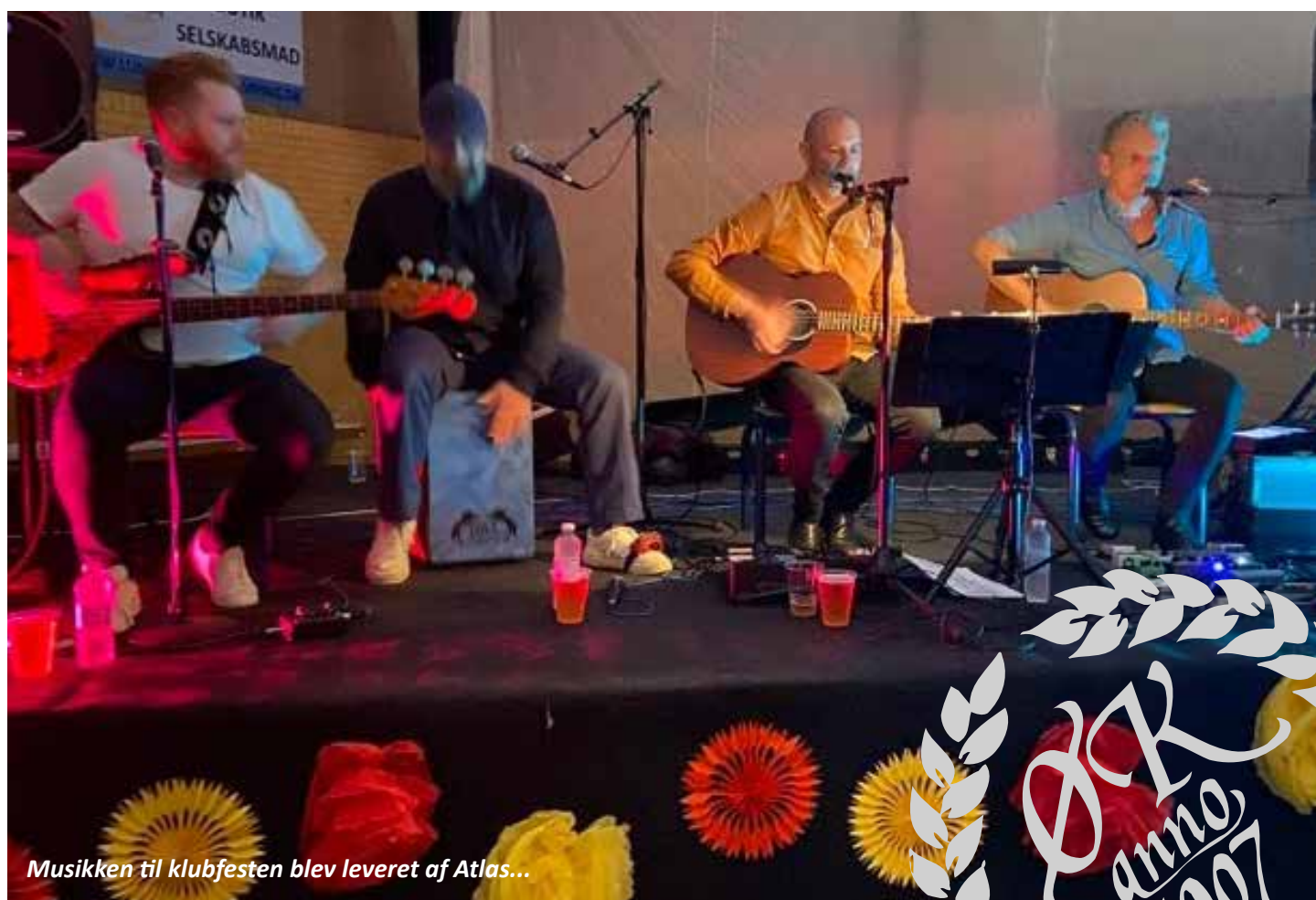
Musikken til klubfesten blev leveret af Atlas...

Sæt X i kalenderen 12. nov. 2022 til Klubfest